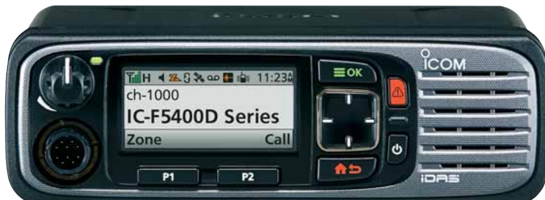
IC-F5400D (VHF) IC-F6400D (UHF)