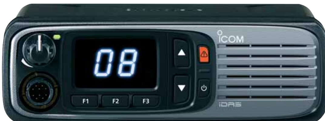
IC-F5400DS (VHF) IC-F6400DS (UHF)